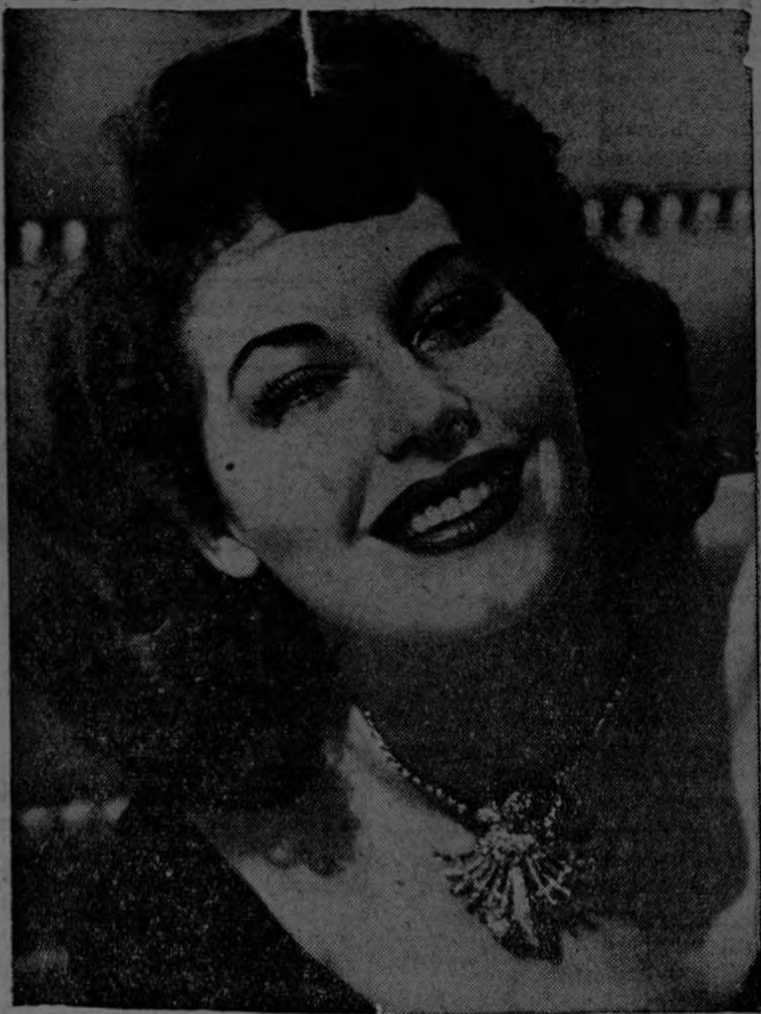
Ava Gardner... linda estrella de la Metro-Goldwyn-Mayer.

La linda, triguena y talentosa Ava Gardner es la más nueva de las luminarias que brillan en el cielo de Hollywood. Pero no ascendió a tal categoría de la noche a la mañana; necesitó seis largos años de arduo trabajo, y a la vez que muchas desilusiones para alcanzar su meta.