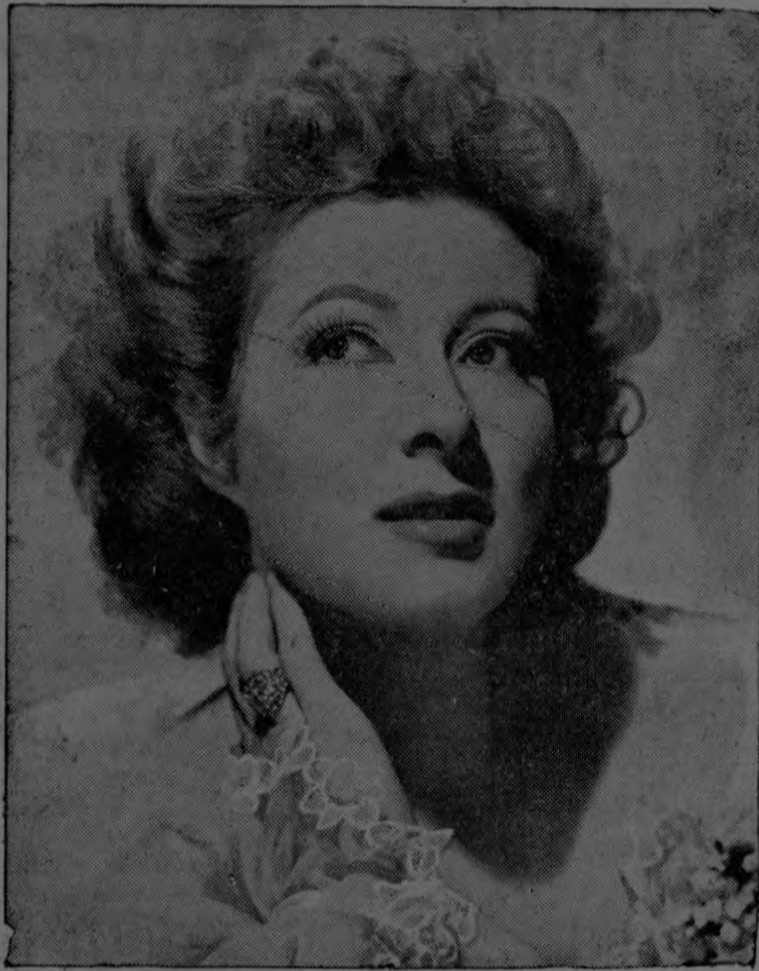
GREER GARSON, la adorable estrella de Metro-Goldwyn-Mayer, es un perfecto ejemplo de que bien vale la pena de arreglarse con cuidado porque el encanto y seducción de la belleza son la consecuencia de tal empeño, como asegura Max Factor Jr. el célebre experto de Hollywood.

pecial propio de esas actividades y habiendo oído repetidamente alabar sus ventajas, no se detienen a considerar que el maquillaje que se usa a diario para las actividades sociales de la mujer no puede ser tan fuerte ni que ha sido hecho de manera precisa y científica. El mismo maquillaje de televisión, que se perfeccionó en mis laboratorios hace unos dos años, requiere una aplicación muy ligera y delicada, a pesar de que el resultado final es demasiado fuerte si se compara con el efecto que debe producir su propia cara al terminar de maquillarse para la vida diaria.